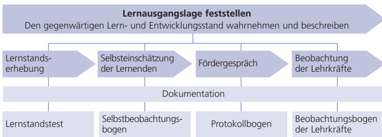
Abbildung 2 Teilprozesse der Diagnose von Lernausgangslagen

Der zentrale Bestandteil dieser Phase ist das Fördergespräch. Dieses Gespräch ist durch wenige Leitfragen strukturiert und orientiert sich an den Schülerinnen und Schülern. Die Ergebnisse des Lernstandstests sowie des Selbstbeobachtungsbogens dienen der Lehrkraft zur spezifischen Vorbereitung auf jedes Einzelgespräch. Der Dialog erfüllt folgende Funktionen: