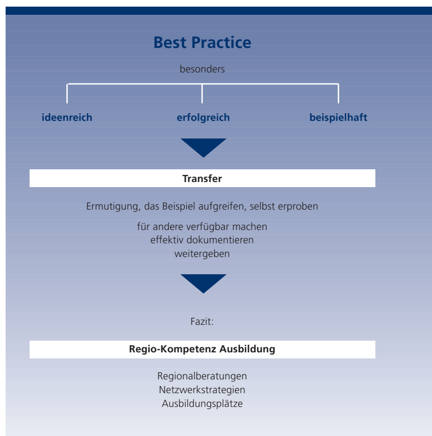
Abbildung 2 Best Practice

Der Wettbewerb hat einen breiten Fundus an Ideen aufgedeckt und publik gemacht und einige Schwerpunkte für die weitere Arbeit in dem Vorhaben vorgegeben; damit wurden die Zielsetzungen des Wettbewerbs insgesamt erreicht. Es ist deshalb vorgesehen, auch in diesem Jahr sowie in den Jahren 2002 und 2003 jeweils einen Wettbewerb in den neuen Ländern durchzuführen, wobei sich die inhaltlichen Vorgaben an den jeweiligen thematischen Arbeitsschwerpunkten des Gesamtvorhabens in dem betreffenden Jahr orientieren. Die jährlichen Wettbewerbe bilden insofern ein wesentliches projektstützendes Element des gesamten Vorhabens Regionalberatung.