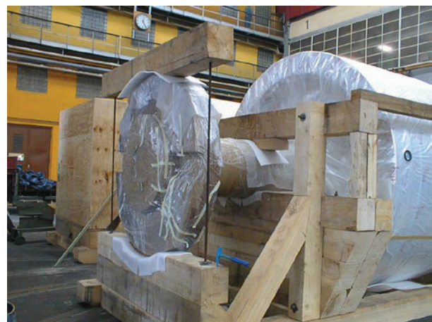
Abbildung 18: Läufer für eine Turbine R. Fritze

Für den Transport eines Läufers für eine Turbine muss ein Packmittel hergestellt werden. Das Maschinenteil wird zuerst per Schwerlast-Lkw und dann per Schiff verschickt.