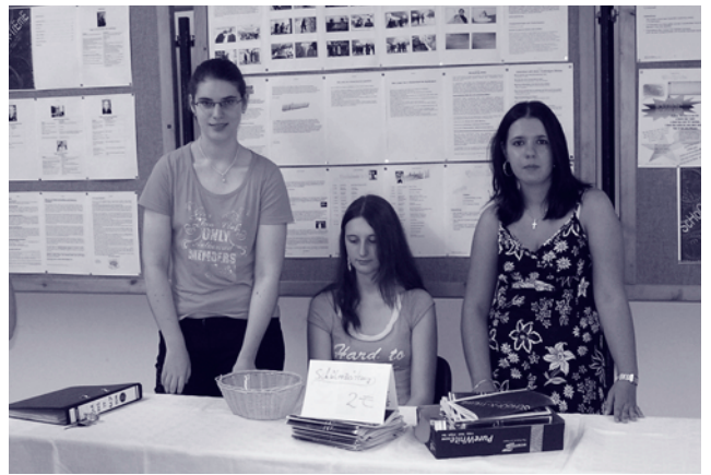
Das Ergebnis einer Berufsaufgabe: Schülerinnen beim Verkauf einer selbstgestalteten Zeitung

Bei der Initiierung – dem Beginn einer Innovation – ist die Beteiligung von Lehrern und Ausbildern besonders wichtig. Deren Mitwirken trägt, im Vergleich zur Entwicklung und Implementierung von Lernumgebungen durch externe Designer, wesentlich zu einer hohen Akzeptanz der Innovation bei. Auch die Qualität der Planung von Innovationen kann einen positiven oder negativen Effekt auf den Erfolg der Innovation haben. Wichtig ist deshalb ein realistischer Zeitplan. Zudem sollte die Unterstützung der Implementierung seitens der Schulleitung, der Lehrer und der Schüler gegeben sein.