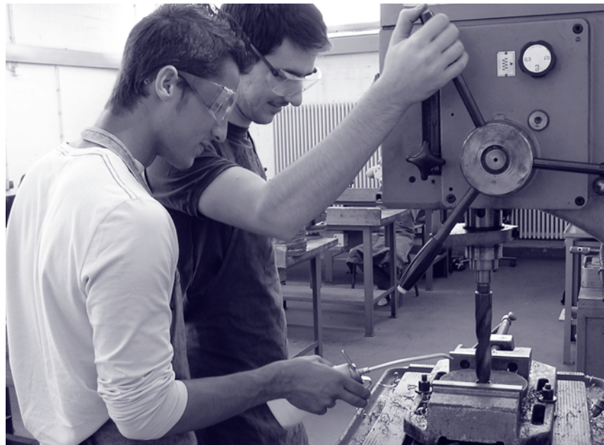
Als Berufsaufgabe fertigen Schüler in kooperativer Arbeit eine Wanduhr an

Mittlerweile haben nahezu alle niederländischen Berufsschulen und Hunderte von Lehrern, Schülern, Schulleitern, Betrieben und Arbeitgeberverbände sich an dieser Form des Unterrichts beteiligt. Es findet eine kontinuierliche Weiterentwicklung statt. Inzwischen wird das Modell auch in der kaufmännischen Ausbildung angewandt.