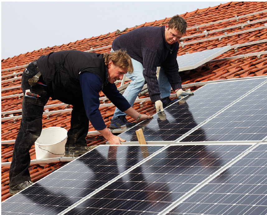
Montage von Solarmodulen.

Mit »Dachdecken« allein ist es nicht getan: Dachdecker/-innen sind rund um Dach und Außenwand am Haus beschäftigt, sie führen energetische Gebäude-maßnahmen durch und installieren Solarthermie- und Fotovoltaik-Anlagen. Der Steckbrief verdeutlicht, wie viel Klimaschutz in dem Ausbildungsberuf steckt, welche Trends sich abzeichnen und wie sich die Auszubildendenzahlen entwickeln.