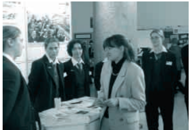
Bundesbildungsministerin Bulmahn im Gespräch mit Auszubildenden der Deutschen Bahn AG

Das am häufigsten genutzte Instrument der Betriebe ist der Einbezug von Auszubildenden in die Betreuung ausländischer Partner oder Kunden: Dies praktizieren fast ein Drittel aller international aktiven Betriebe. An zweiter Stelle steht die innerbetriebliche Schulung berufsbezogener Fremdsprachenkenntnisse, die gut ein Viertel der Betriebe ihren Auszubildenden anbietet. Auslandspraktika sind für Lehrlinge in immerhin 18 Prozent der Ausbildungsbetriebe möglich. Bezogen auf diejenigen Unternehmen, die internationale Geschäftskontakte pflegen, liegt dieser Anteil bei 21 Prozent, bei jenen mit Standorten im Ausland sogar bei 28 Prozent.