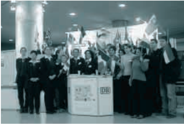
Europäische Auszubildende am Stand der Deutschen Bahn AG anlässlich der Eröffnung des Europäischen Jahres der Sprachen

innovativen Know-how anderer zu partizipieren, wird als wesentlicher Schritt zur Verbesserung der Marktposition des Unternehmens gewertet.