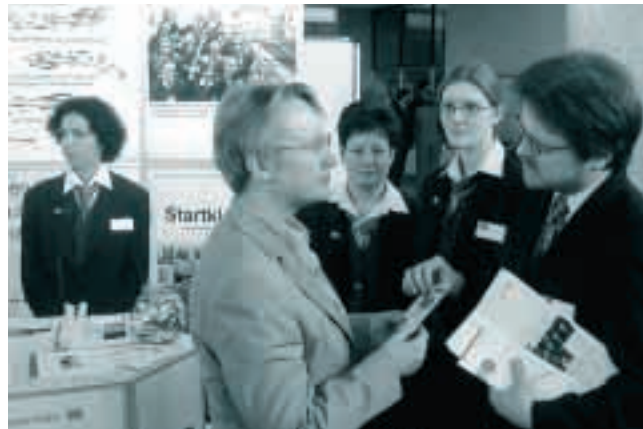
Der Präsidentin der Kultusministerkonferenz Dr. Schavan wird das Lernprogramm „Service by heart“ der Deutschen Bahn AG überreicht

Angesichts der wachsenden Bedeutung transnationaler Kooperationen auf allen Ebenen des Unternehmens ist dies nur der Beginn einer weit reichenden Internationalisierung der innerbetrieblichen Bildungs- und Personalarbeit. Sie wird sich, unter wachsender Nutzung auch mediengestützter Vermittlungs- und Kooperationsformen, in den nächsten Jahren weiter verstärken.