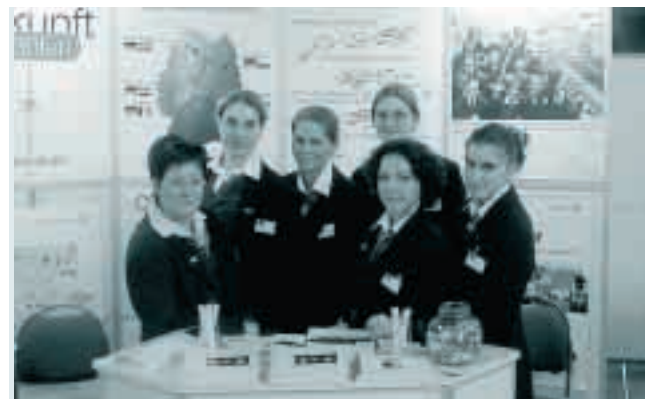
Internationale Auszubildende der Deutschen Bahn AG

Aktuelle Untersuchungen, die sich mit Fragen internationaler Unternehmenszusammenschlüsse und den sich daraus ergebenden personalwirtschaftlichen und unternehmenskulturellen Problemen beschäftigen (APFELTHALER/REDER/MÜLLER 1999; SCHMIDT/SCHELLER 1999), bestätigen, dass im Zuge internationaler Unternehmenszusammenschlüsse die personalwirtschaftlichen und unternehmenskulturellen Probleme steigen. In die gleiche Richtung weisen die Ergebnisse der Befragung bei 84 global agierenden Unternehmen, die das ISF in München in 1998/99 durchgeführt hat (MEIL/DÜLL, S. 7 ff.). Angesprochen auf ihre Erfahrungen und Praktiken im Qualifikationsmanagement bei Internationalisierungsstrategien, räumt die Mehrzahl der befragten Unternehmen „Schwächen bei der Bereitstellung von Informationen und Qualifikationen (ein), die für die Einleitung von Internationalisierungsmaßnahmen als erforderlich angesehen werden“ (Ebenda, S. 8).