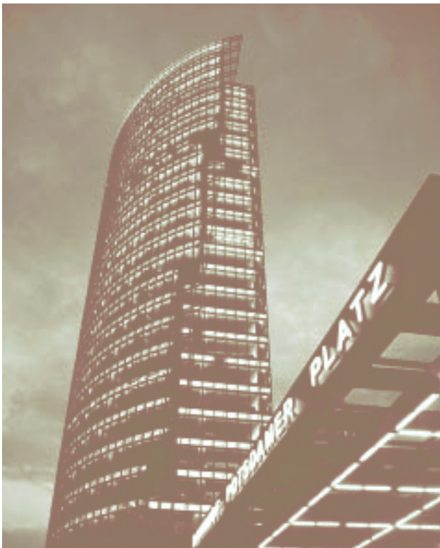
Berlin – Potsdamer Platz

In den vergangenen Jahren gewannen qualitätssichernde Maßnahmen zunehmend an Bedeutung. Daher wird die Position „Qualitätsmanagement“ in den Katalog der Fertigkeiten und Kenntnisse neu aufgenommen. Ausgebildete Bauzeichner sind gehalten, ihre eigenen Arbeitsvorgänge kontinuierlich selbst zu kontrollieren und gegebenenfalls zu verbessern. Dieses müssen Auszubildende bereits in der Ausbildung lernen.