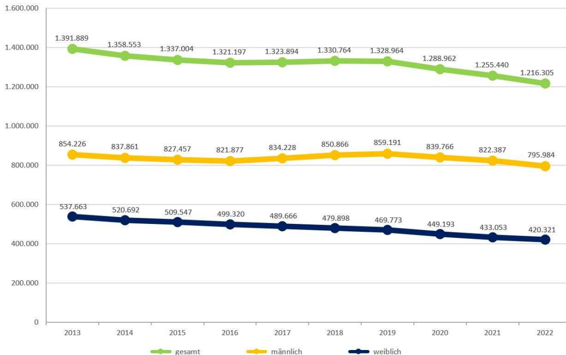
Abbildung 2: Entwicklung der Zahl der Auszubildenden