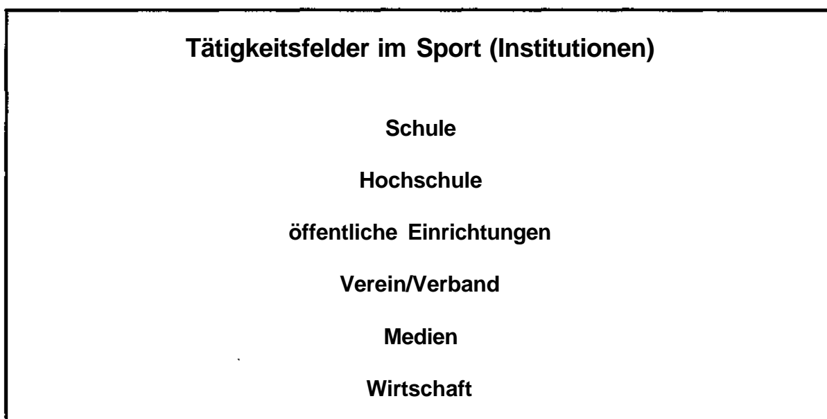
Abb. 1: Tätigkeitsfelder im Sport (Institutionen)

Aufgrund dieser schlechten Berufsperspektive orientieren sich immer mehr Studierende innerhalb ihres sportwissenschaftlichen Fachstudiums um Vorlesungen und Seminare, die Informationen, Kenntnisse und Fähigkeiten für Aufgaben und Tätigkeiten im außerschulischen Bereich vermitteln, erleben vielerorts einen enormen Zuspruch, der nicht immer ausreichend befriedigt werden kann. Für Lehrangebote dieser Art fehlt oft das qualifizierte Personal an den Instituten. Auch hier ergibt sich - wie sollte es anders sein - wieder ein „Verteilungskampf: Neue Studieninhalte konkurrieren mit altbewährten, in denen es sich so manche Kolleginnen und Kollegen „bequem“ gemacht und ihre Kapazitäten verplant haben. Hier ist ein Umdenken gefordert, um den Studierenden entsprechende Inhalte und Qualifikationen für außerschulische Tätigkeitsfelder (Abb. 1) zu vermitteln.