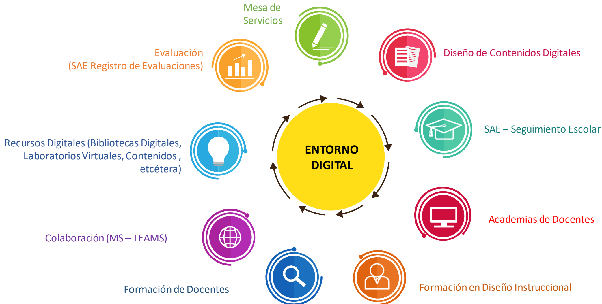
Diagrama de funcionamiento