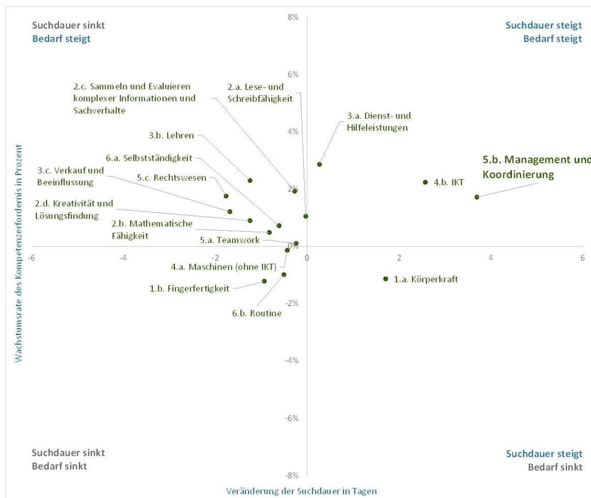
Abbildung 3: Veränderung von Kompetenzbedarf und Fachkräftesituation von 2023 bis 2040