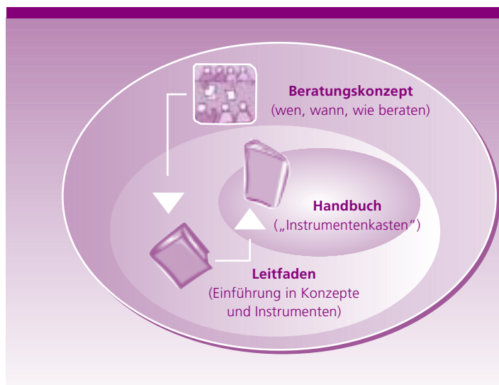
Abbildung 2 Das FILIP-Beratungskonzept

samt. Geschäftsführer wollen hierüber künftig intensiver informieren, was auch von Meistern, Gruppenführern, aber auch von Betriebsräten vermehrt gefordert wird. Umgekehrt halten Unternehmen eine bessere Orientierung über Wünsche und Einstellungen ihrer Beschäftigten für erforderlich, was als Ausweis einer relativen Abhängigkeit der Unternehmensentwicklung von diesen subjektiven Faktoren angesehen werden darf. Eine intensivere Arbeit an der Unternehmenskultur (Unternehmensgrundsätze, Führungsgrundsätze, Mitarbeiterbefragungen, Arbeit an der Familienfreundlichkeit des Unternehmens etc.) wird daher in allen befragten Unternehmen für erforderlich gehalten.